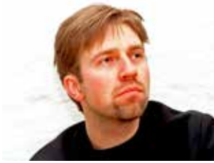
Pianist Leif Ove Andsnes.