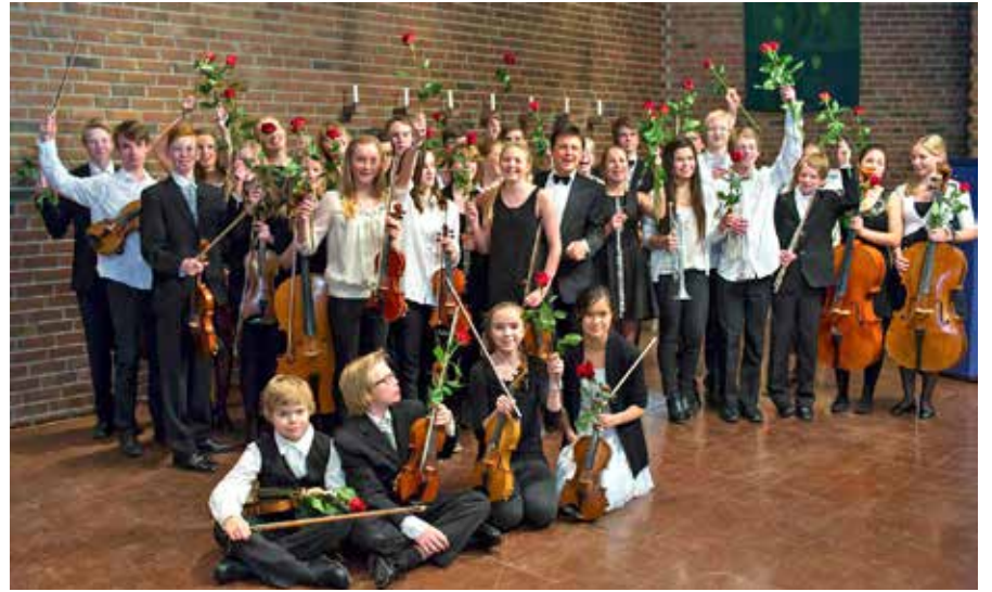
Musica Sinfonietta - Asker ungdomsorkester.